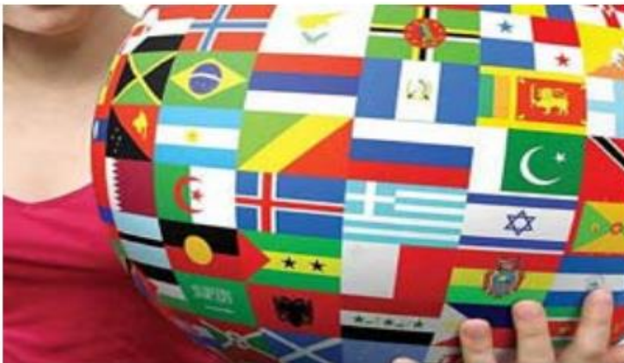
ВТОРОЙ ИНОСТРАННЫЙ ЯЗЫК