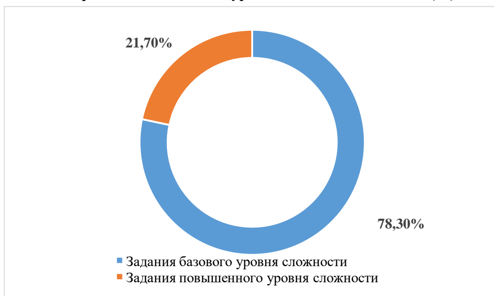
Распределение баллов по уровню сложности заданий (%)