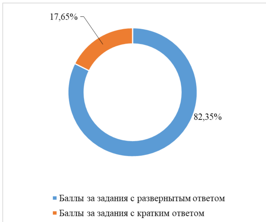
Распределение баллов по типам заданий (%)