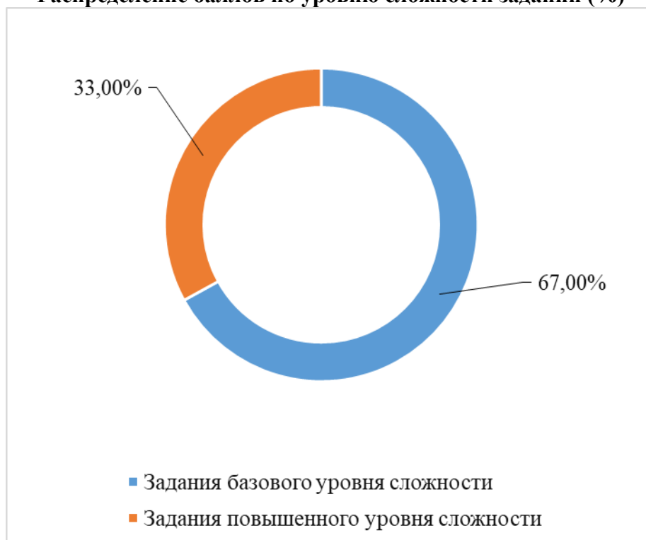
Распределение баллов по уровню сложности заданий (%)