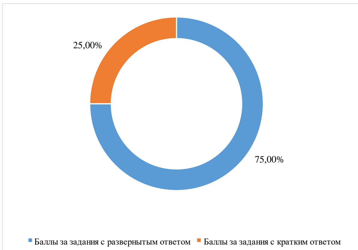
Распределение баллов по типам заданий (%)

Распределение баллов по уровню сложности заданий приведено на диаграмме 2.