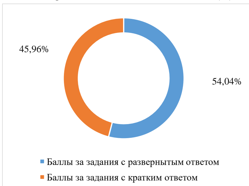
Распределение баллов по типам заданий (%)