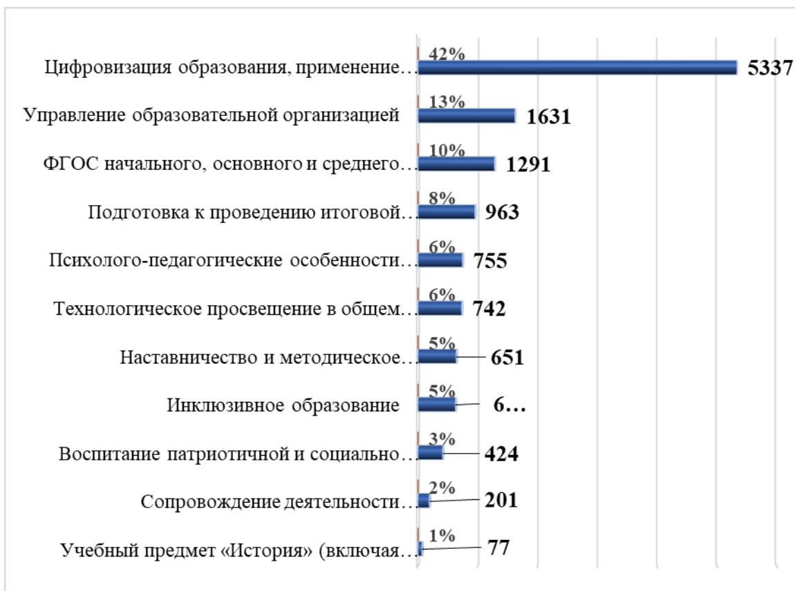
Рис. 1. Доля педагогических работников, прошедших обучение в АУ «Институт развития образования», в разрезе направлений повышения квалификации

Из 61 дополнительной профессиональной программы повышения квалификации разработаны и реализованы впервые в 2025 году 35 образовательных программ (таблица 2):