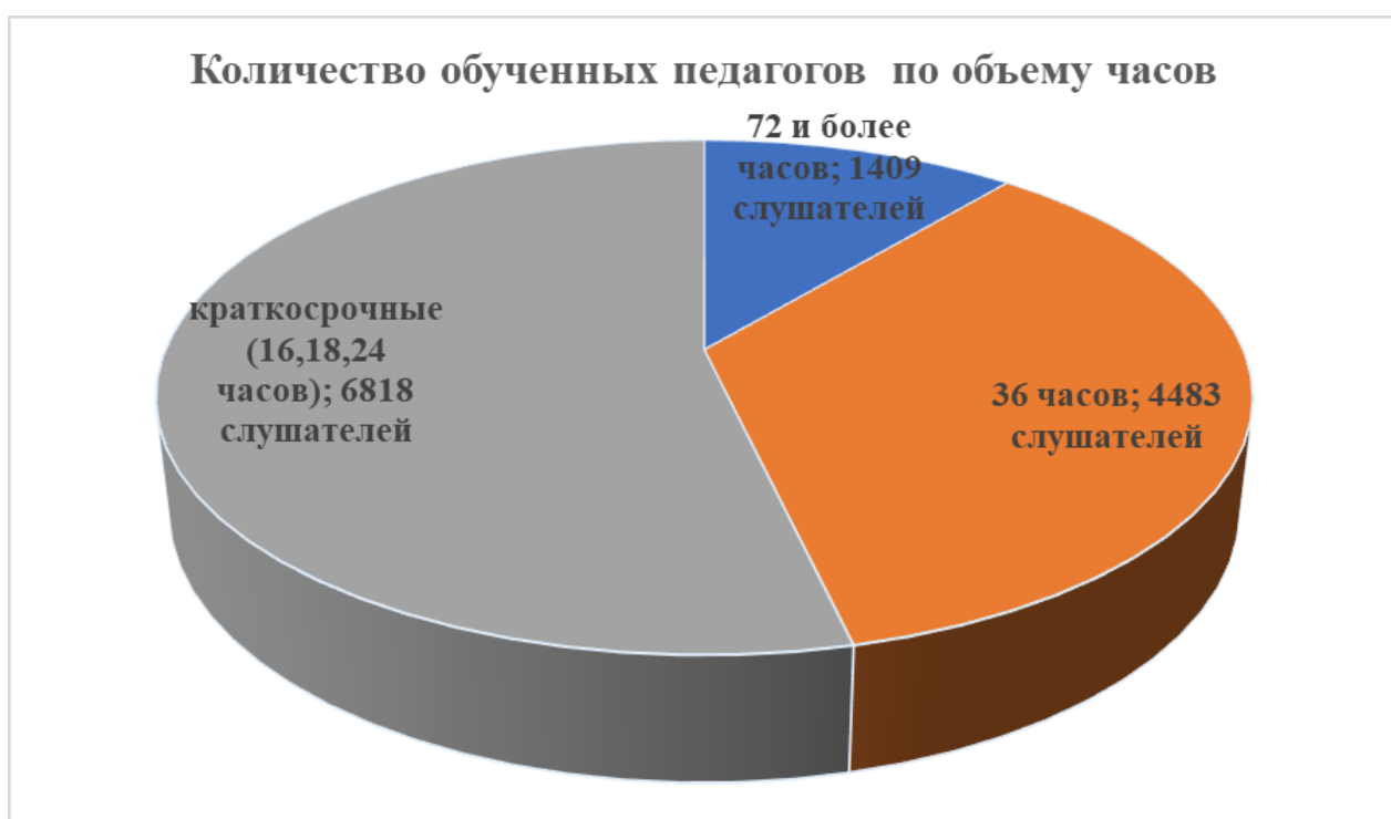
Рис. 2. Количество педагогов, прошедших обучение в 2025 году, в разрезе объема курсового мероприятия

В 2025 году на курсах повышения квалификации объемом 72 часа и более (55 курсовых мероприятий) прошли обучение 1409 слушателей, курсах объемом 36 часов (179 курсовых мероприятий) - 4483 слушателей и на краткосрочных курсах объемом 16, 18, 24 часов (272 курсовых мероприятий) – 6818 слушателей. Большая часть педагогов (53,6 %), в соответствии с плановыми показателями государственного задания, обучились на краткосрочных курсах повышения квалификации (рис.2).