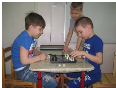
Рис. 8. Шахматная партия

Практическая часть включает итоговые шахматные турниры в рамках кружковой деятельности, шахматный турнир по определению лучшего шахматиста детского сада.