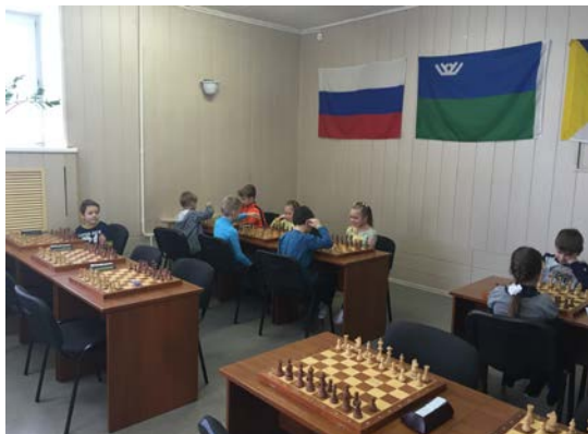
Рис. 13. Первенство в городском шахматном клубе