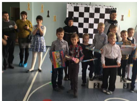
Рис. 12. Награждение(2 место)

Также воспитанник кружка участвовал в городском первенстве по шахматам среди детей до 9 лет, проходившем на базе шахматного клуба.