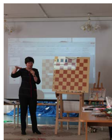
Рис. 20. Мастер-класс