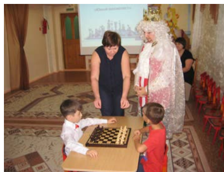
Рис. 10. Первая партия

В марте 2017 года мой воспитанник участвовал в городском первенстве по шахматам среди воспитанников (6-7 лет) ДООУ и занял 2 место.