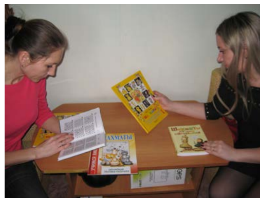
Рис. 18. Выставка шахматной библиотеки

Для поддержания у детей устойчивого интереса к игре в шахматы родителям была рекомендована организация домашнего шахматного уголка.