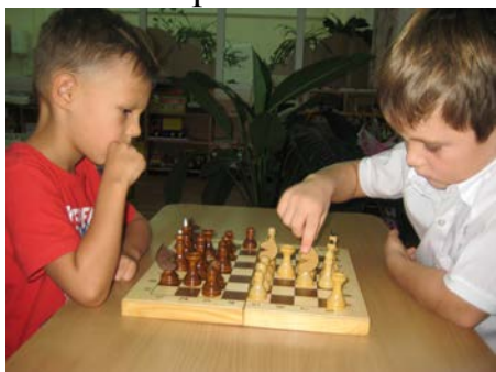
Рис. 7. Шахматная партия

Это практическая часть обучения. Во время шахматных партий дети получают неоценимый игровой опыт, одерживают первые победы и учатся «стойко переносить» первые поражения. Обучающиеся познают дух соперничества и соревнования.