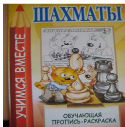
Рис. 2. Обучающая пропись-раскраска

На данном этапе эффективно использовала дидактические упражнения «Покажи Горизонтالي», «Покажи Вертикали», «Покажи диагонали», «Назови адрес», «Засели фишку по адресу» и др.