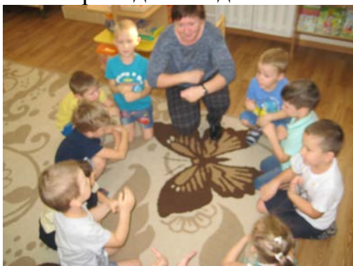
Рис. 5. Динамическая пауза «Заведём моторы»

Соревновательный элемент и игровая мотивация, используемые в процессе обучения, способствовали повышению познавательного интереса детей, концентрации внимания, развитию произвольной памяти. Так как занятия носили большую интеллектуальную нагрузку, в середине занятия обязательно проводились динамические паузы или физкультминутки.