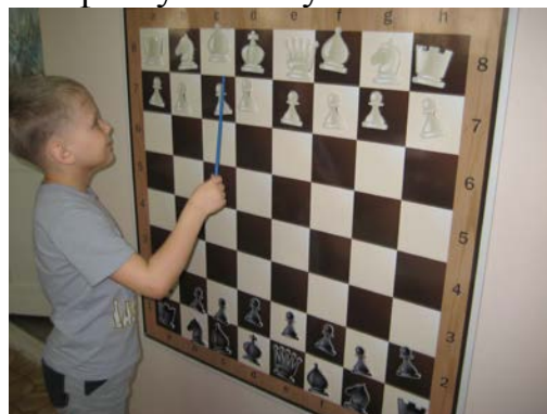
Рис. 6. Знакомство с шахматными фигурами и пешками