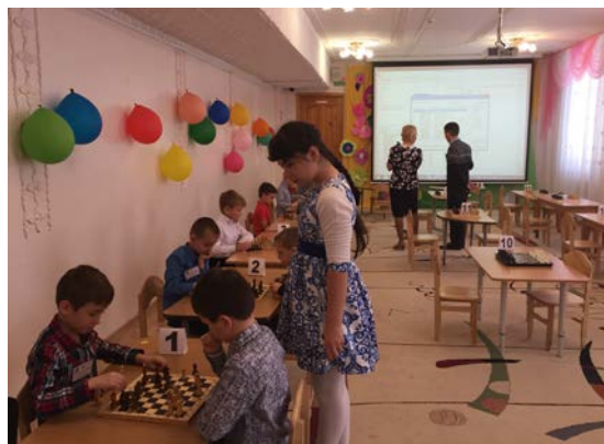
Рис. 11. Городское первенство по шахматам

В марте 2017 года мой воспитанник участвовал в городском первенстве по шахматам среди воспитанников (6-7 лет) ДООУ и занял 2 место.