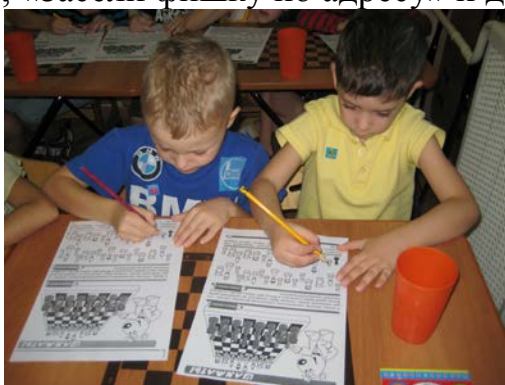
Рис. 3. Работа в раскрасках по теме «Шахматная доска» (6-й год жизни)

На данном этапе эффективно использовала дидактические упражнения «Покажи Горизонтالي», «Покажи Вертикали», «Покажи диагонали», «Назови адрес», «Засели фишку по адресу» и др.