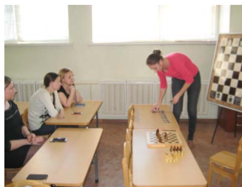
Рис. 15, 16. Семинар-практикум для родителей «Учимся играть в шахматы»