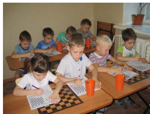
Рис. 4. Работа в раскрасках по теме «Шахматная доска» (7-й год жизни)

Выполняя задания в шахматных раскрасках, дети закрепляли знания по