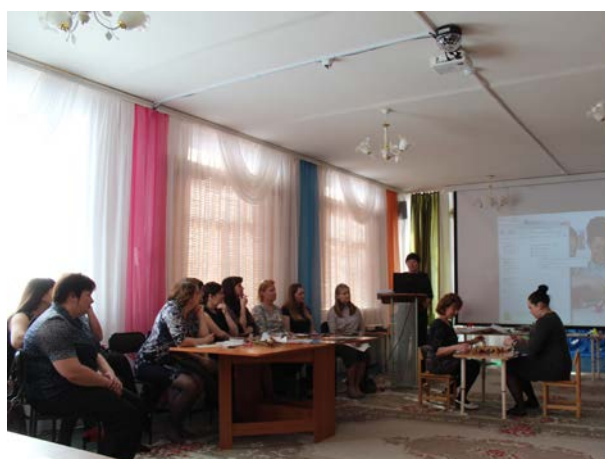
Рис. 19. Диссеминация опыта работы