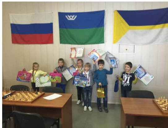
Рис. 14. Награждение (7 место)

В данный период один из выпускников шахматного кружка посещает городской шахматный клуб и принимает активное участие во Всероссийских соревнованиях в соответствии с возрастной категорией до 9 лет.