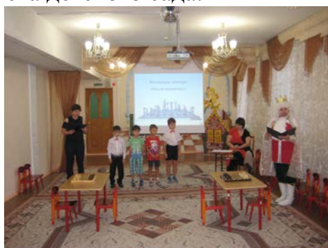
Рис. 9. Открытие шахматного фестиваля

Практическая часть включает итоговые шахматные турниры в рамках кружковой деятельности, шахматный турнир по определению лучшего шахматиста детского сада.