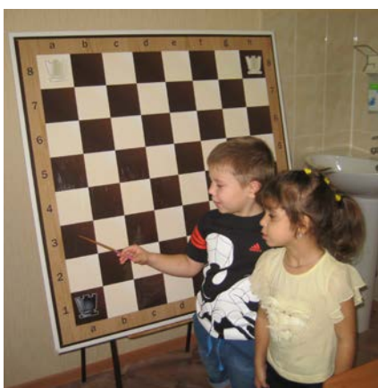
Рис. 1. Волшебные дорожки

Целью данного этапа являлось овладение пространственным ориентированием на плоскости, знакомство с названиями шахматных дорожек: горизонталь, вертикаль, диагональ, умением видеть всю доску, а также отдельное поле.