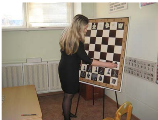
Рис. 17. Первый ход конём